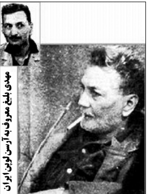
مهدی بلبع معروف به آرسن لوین ایران

مهدی بلبع معروف به آرسن لوین ایران که یکی از بزرگترین جانیان و کلاهبرداران تاریخ جزایری ایران است