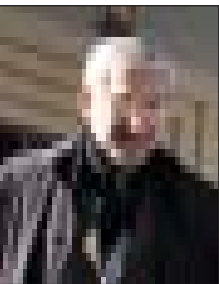
وزیر مسکن و شهرسازی گفت: قیمت اجاره بهای مسکن و زمین در کشور کاهش یافته است.

به گزارش واحد مرکزی خبر، سید محمد سلیمانی در حاشیه جلسه هیئت دولت در جمع خبرنگاران گفت: شرکت پست جمهوری اسلامی ایران در حال تفکیک شدن بخش های حاکمیتی و غیر حاکمیتی است. واگذاری به بخش خصوصی است. وی درباره شرکت TIMC نیز گفت: این شرکت نیز ۱۰۰ درصد خصوصی است.