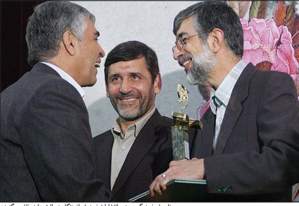
غلامعلی حدادعادل، رئیس مجلس شورای اسلامی، استقبال خوب و قلیل جشنواره یازدهمین کنفرانس نوزدهمین نمایشگاه بین‌المللی کتاب تهران را شکر می‌کند.

اعظم (ص) اشاره کرد و به ارائه آثار ارقامی نمایشگاه کتاب اسامیل پرداخت. برخی از این آثار و ارقام، در گزارش های پیشین ریاست نوزدهمین نمایشگاه داخلی آمده بود که در جمله آنها می‌توان به تعداد نشران داخلی و خارجی شرکت‌کننده در نمایشگاه اشاره کرد. علاوه بر این‌ها، حتی به بخش اطلاع‌رسانی کتابخانه نوزدهم اشاره کرد که یک رشد قابل توجه همراه بوده است. وی گفت: «سپس به ارائه محل نمایشگاه اشاره کرد و به روند تغییر جهت اطلاع‌رسانی کتابخانه داخلی، به روزسازی سایت اطلاع‌رسانی نمایشگاه، بازدیدکنندگان بیش از ۲ میلیون کاربر اینترنتی از جمله خدماتی بود که اسامیل در حاشیه‌های نمایشگاه صورت گرفت.»