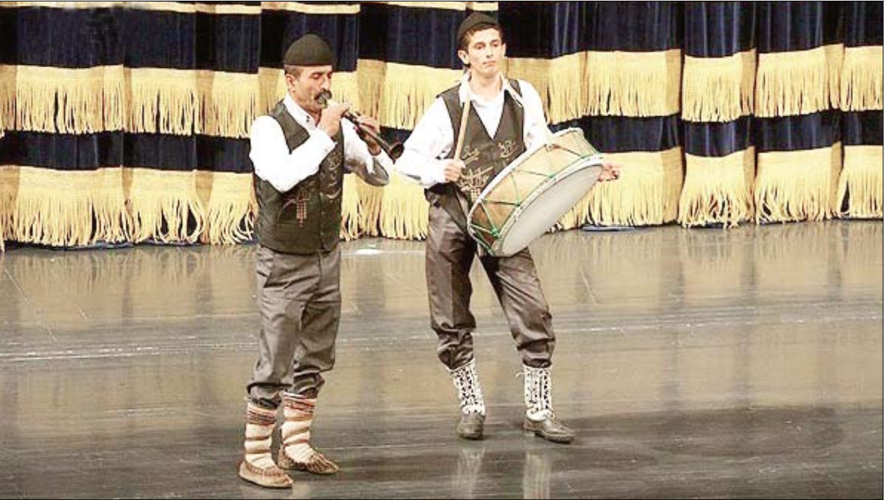
عکاس: مصطفی کاظمی - روز یکم