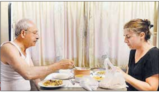
Hamiretv Daily News

دربی انتشار تصویری از رهبر حزب مردم جمهوریخواه ترکیه با لباس راحتی (زیربوش) در یکی از شب‌های راهپیمایی عدالت، رجب طیب اردوغان این تصاویر را توهین به ملت ترکیه خواند و این عکس را تبلیغاتی دانست.