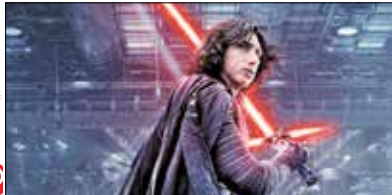
«جنگ ستارگان ۸» صدرنشین گیشه ژاپن

دنیاله جدید «جنگ ستارگان» جدیدترین محصول مشترک استودیو «لوکاس فیلم» و «دیزنی» بعد از چهار هفته اکران در گیشه سینماهای ژاپن همچنان صدرنشین است. به گزارش «آی سینما» مجموع تعداد بلیت‌های فروخته شده «جنگ ستارگان آخرین جدای» به ۴.۱۶ میلیون رسیده و کل فروش این فیلم در گیشه ژاپن به بیش از ۵۵ میلیون دلار رسیده است.