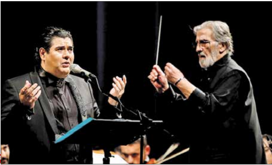
اجرای ارکستر ملی، با رهبری فریدون شهبازین و خوانندگی سالار عقیلی

وزیر ارشاد: نمی‌خواهیم بگوییم موسیقی پاپ باید بی‌مخاطب و بی‌مشتری باشد و مخاطب داشتن این گونه موسیقیایی اصلاً نقص نیست ولی ما بر این باور هم هستیم که موسیقی سنتی و کلاسیک هم باید ارتقای مخاطب پیدا کند