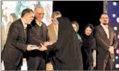
پایان جام‌باشگاه‌های کتابخوانی با حضور وزیر ارشاد