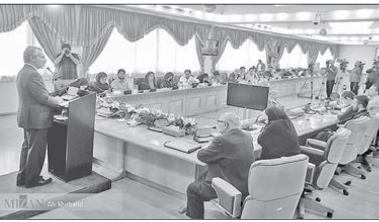
سرویس سیاسی -

در شرایطی که مقامات دولتی تا دیروز کنشورهای غربی طرف برجام از جمله آمریکا را جامعه جهانی معرفی می‌کردند و از سویی این کشورها در مواجهه با ایران، هیچ اختلافی با آمریکا ندارند، مشخص نیست که معنای سخنان نوبخت مبنی بر ایزوله شدن آمریکا در صورت خروج از برجام به چه معناست؟